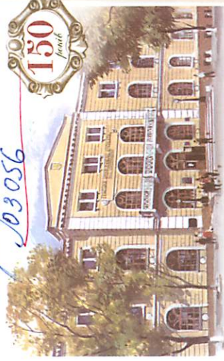
Одеський національний університет ім. І.І. Мечникова

ДТТУ КДТ г.р.ст м. Київ пр. м. Черемом. 37. корпус 7 Ю3056